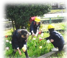
チューリップの花摘み

学校では、今年度も学級担任だけでなく、できるだけ多くの教職員と子供たちが関わることができるよう、授業や生活面でも工夫して、複数のチームで見守り、支援できるようにすることで、子供たちが安心して学校生活を送ることができるよう努めます。家庭と学校と地域が一体となって、子供たちを育てていくことができるよう、ご協力を、お願いいたします。