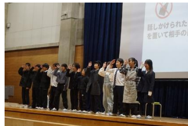
〈 6年 目指せインターネットマスター!!! ～SNSを正しく使うには～ 〉