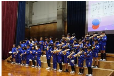
〈 2年 歌って、踊って、リリパティ〜 〉