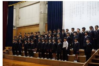
〈 3年 やなせたかしの世界 〉