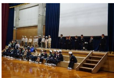
〈 1年 みんなでかいけつ！大きなかぶ 〉