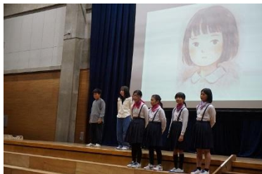
〈 5年 音読劇「たずねびと」 〉