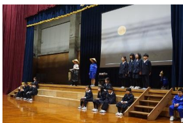
〈 4年 音読劇「ごんぎつね」 〉