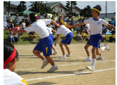
上学年選手リレー