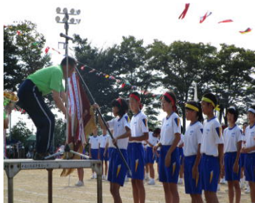
表彰式 総合優勝 赤団