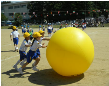
1・2年大玉ころりん！

保護者の皆様、地域の皆様、児童の活躍に、最後まで大きなご声援ありがとうございました。