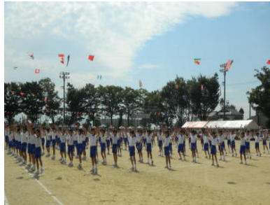
3・4年新・新川古代神